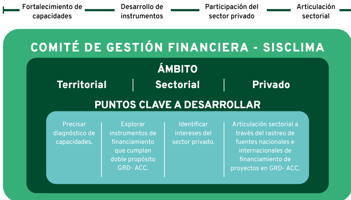
Figura 5 Ruta de articulación para el financiamiento de la gestión del riesgo y la adaptación al cambio climático.