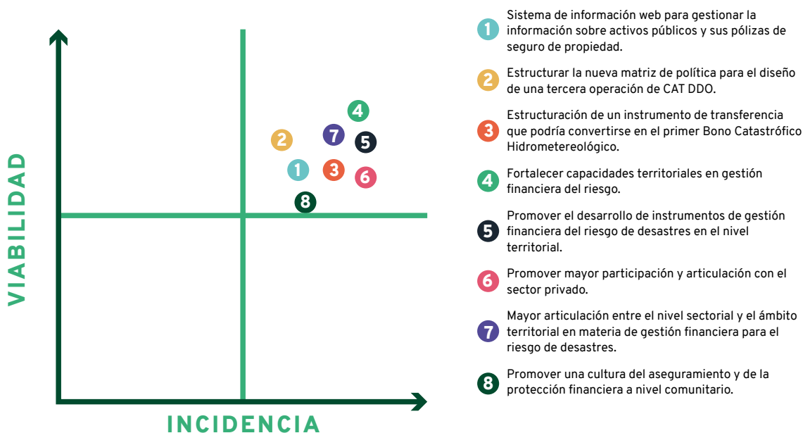
Figura 2. Calificación de temas por incidencia y viabilidad

Los temas priorizados por los participantes tienen injerencia directa en el ámbito territorial y sugieren la participación del sector privado y una mayor articulación sectorial con el nivel territorial. Esto supone retos y desafíos tanto para el SNGRD como para el SISCLIMA en la estructuración y definición de una agenda que busque articular estos temas en el marco de estrategias y mecanismos de financiación.