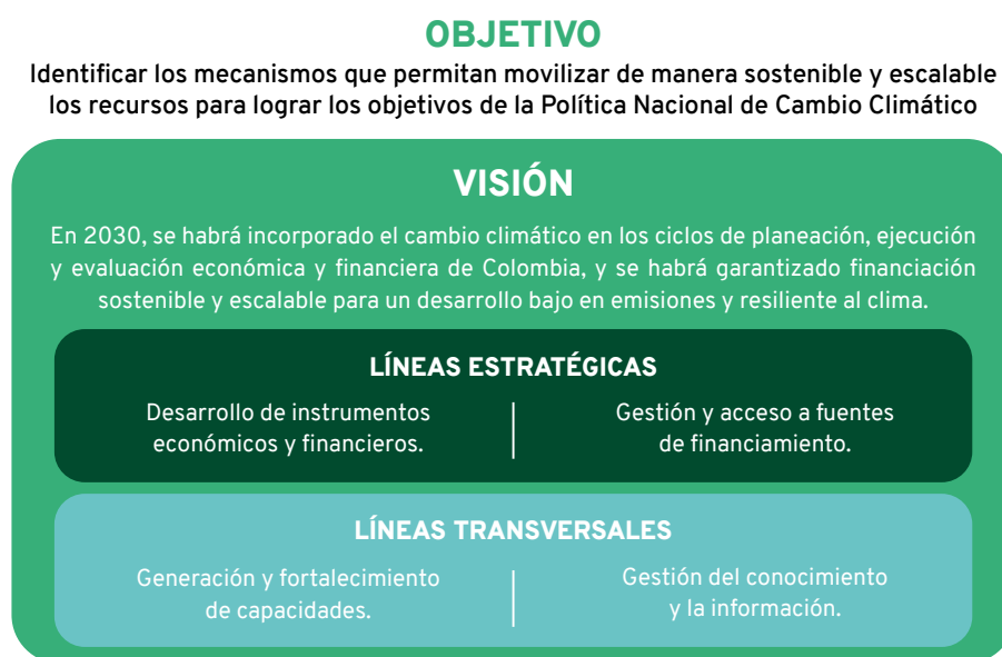
Figura 1 Componentes de la Estrategia Nacional de Financiamiento Climático.

A partir del diagnóstico realizado por el MinAmbiente en el año 2016, el Comité de Gestión Financiera formuló la ENFC y definió en sus componentes el objetivo, la visión y cuatro líneas de acción divididas en dos líneas estratégicas y dos líneas transversales. Estas líneas están dirigidas a atender los retos del financiamiento climático en el país y avanzar en la movilización de recursos para garantizar la financiación del desarrollo bajo en carbono y compatible con el clima. La Figura 1 resume el contenido de las líneas de acción de la ENFC.