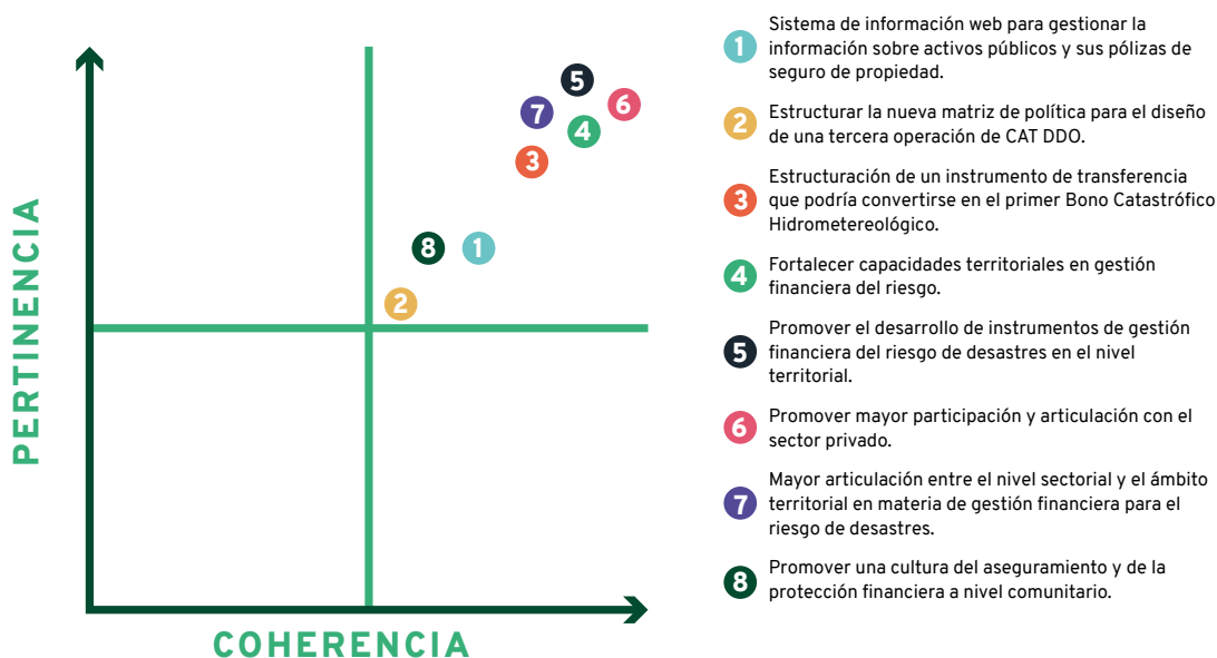
Figura 1. Calificación de temas por coherencia y pertinencia